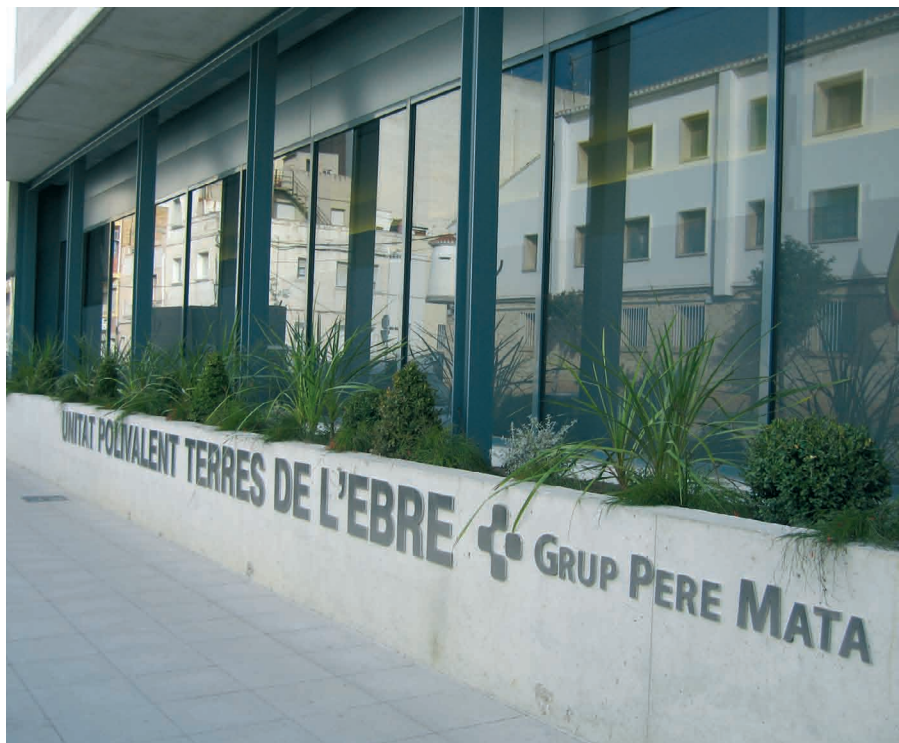
Els treballadors i treballadores de la Fundació Pere Mata Terres de l'Ebre han acordat la reducció salarial

L a direcció de la Fundació Pere Mata Terres de l'Ebre i el 100% dels 90 treballadors i treballadores han aprovat suspendre temporalment la retribució variable del sou de la paga de Direcció Per Objectius (DPO) fins al 31 de desembre de 2013, que representa de forma