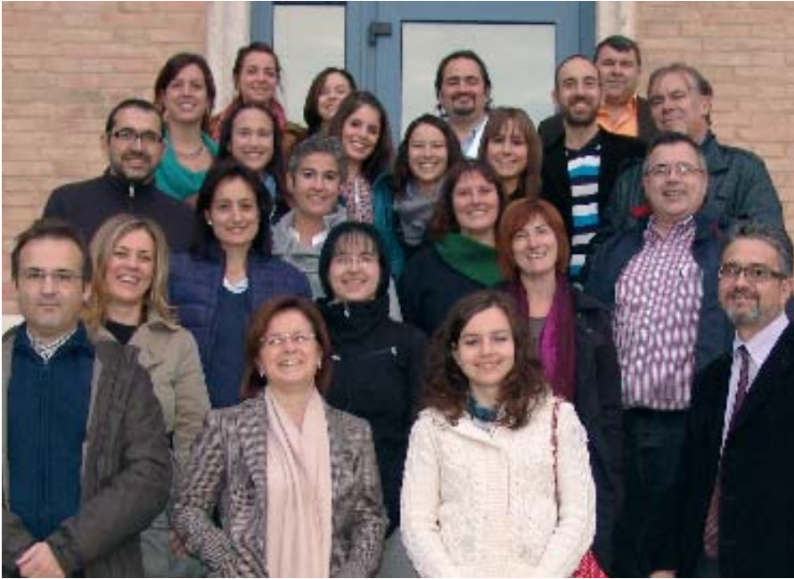
Grup d'investigadors de l'Institut Pere Mata i de Villablanca

Actualment, el Grup Pere Mata compta amb quatre grups de recerca i una vintena d'investigadors. Tres d'aquests grups se situen a l'Hospital Universitari Institut Pere Mata i un altre a Villablanca a través de la Unitat d'Investigació en Discapacitat Intel·lectual i Trastorns del Desenvolupament (UNIVIDD), i representen una de les apostes més decidides per guanyar en qualitat i excel·lència assistencial.